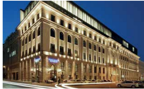
Das festliche Galadinner findet im Humboldt Carré am Gendarmenmarkt statt.