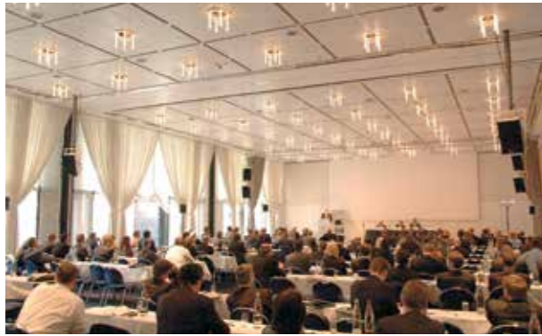
In diesem Jahr finden die unternehmensrelevanten Diskussionen wieder im Sheraton Berlin Grand Hotel Esplanade statt.